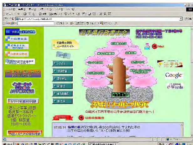
↑ ホームページトップ画面

会報のフルカラー版はホームページ 「会報いわて」のコーナーに 掲載しております。 ホームページアドレスは http://iwate-gyosei.jp/index.html です。