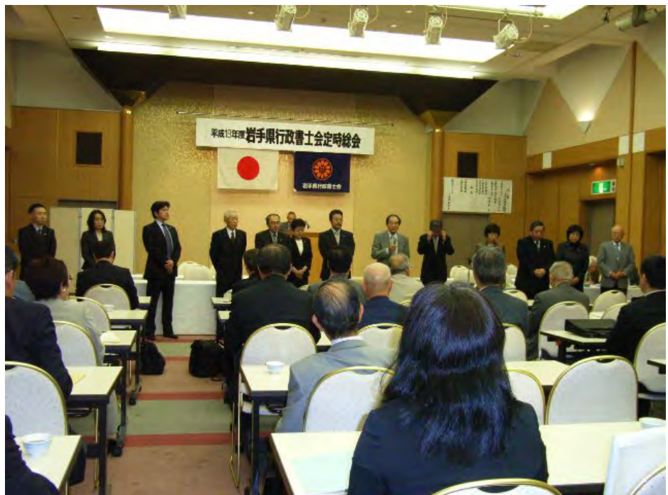
定時総会において選任された新役員の面々