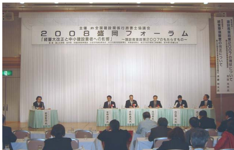
盛岡フォーラム 第二部 パネルディスカッション

関係者からは、近年にない盛り上がったフォーラムであったと評されるなか、本フォーラムは閉幕しました。