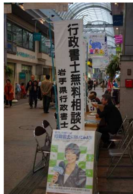
行政書士制度広報月間 街頭無料相談 (ホットラインサカナチョウ)