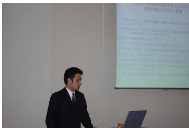
講座で講師を務める神山委員（水沢支部）

本会におきましては、成年後見関係を社会貢献事業の一つとして掲げており、次年度も継続して開催できるよう、PR方法を含め検討していくこととしております。