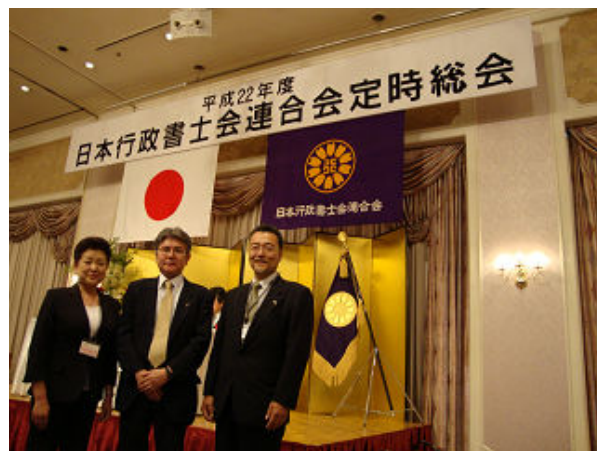
岡山市にて開催の日行連総会にて

今回の総会に参加し、来賓の方々初め日行連役員、全国単位会の代議員の方々と交流でき、有意義な2日間でありました。